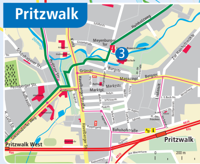
Karten: Jens Otto, heinzel&röhr, Grundlage: VBB/kontur GbR